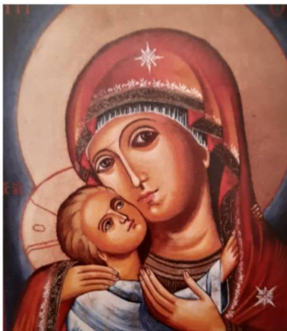
Moeder Gods Eleousa

Gabriël is een aartsengel die als boodschapper van God een belangrijke rol speelt in de bijbel. Wij kennen hem vooral uit het evangelie van Lucas. Een engel kondigde aan Zacharias de geboorte van zijn zoon, Johannes de Voorloper, aan. Zacharias vraagt hem of die boodschap wel juist is. Hierop antwoordt de engel: 'Ik ben Gabriël die altijd in Gods nabijheid is en ik ben gezonden om je dit goede nieuws te brengen.' De voor de christenen belangrijkste rol van de engel Gabriël is zijn aankondiging aan Maria van haar aanstaande maagdelijke zwangerschap en de geboorte van Jezus. (Lucas 1, 26-38). Daar zegt hij de woorden die ons zo lief zijn: 'Wees gegroet, vol van genade, de Heer is met U.' De dag waarop dit plaats vindt gedenken we op 25 maart, 9 maanden voor Kerstmis.