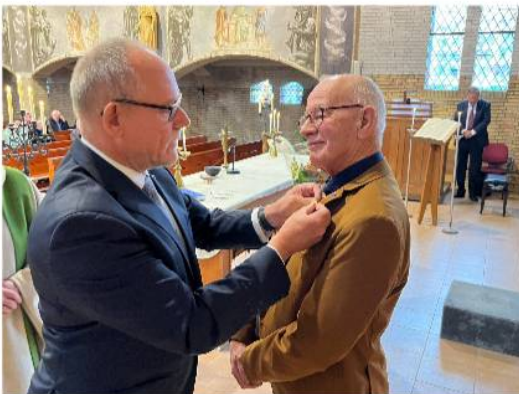
De versierselen bestaan uit een draagmedaille en een baton die op de linker revers gedragen dient te worden.